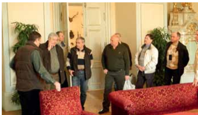
Mežniecībai pieder pils, kurā tiek uzņemti viesmednieki

Valsts meža dienesta virsmežziņiem aprīļa sākumā bija iespēja iepazīties ar aktuālajiem mežsaimniecības, dabas aizsardzības un medību saimniecības jautājumiem, problēmām un darbu organizāciju Čehijas Republikā.