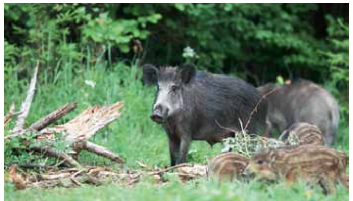
Zaudējumu apmēru noteiks, ja būs veikti aizsardzības pasākumi

Komisijas darbu vadīs pašvaldības pārstāvis un lēmumus pieņems ar vienkāršu balsu vairākumu. Komisija medijamo dzīvnieku nodarīto postījumu izvērtēs, ievērojot zemes īpašnieka (tiesiskā valdītāja), nomnieka (apsaimniekotāja) vai ganāmpulka īpašnieka (turētāja) iesniegumu par medijamo dzīvnieku nodarītajiem postījumiem. Komisijas sēdē un postījumu vietas apsekošanā piedalās arī tās zemes īpašnieks vai tiesiskais valdītājs, kurā konstatēti postījumi, kā arī medību tiesību lietotājs, ja tāds ir, vai medību tiesību lietotājs ģeogrāfiski tuvākajā medību platībā, kurā ir šo postījumu iespējama iemesls.