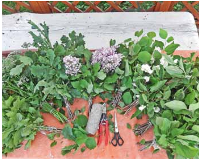
Viss, kas paliek pāri sienot pirts slotas, ir noderīgs

Plašāk par ārstniecības augiem un to lietošanu var uzziņāt Meža konsultāciju pakalpojumu centra organizētajos semināros sadarbībā ar Zeltīti Kavieri (informācija: www.laukutiks.lv ).