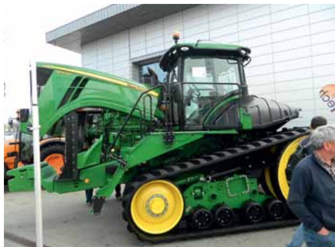
Izstādē plaši tika izstādīta jaunā tehnika