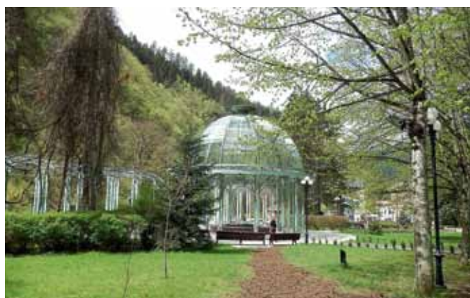
Boržomi nacionālais parks ar slavenā minerālūdens paviljonu

Meža izmantošana notiek līdzīgi kā pie mums agrāk – mežsaimniecības izsniedz atļaujas ciršanai un ierāda ciršanai paredzētās platības. Atļaujas var iegādāties ikviens. Tomēr ir nosacījums, ka nepārstrādātus kokmateriālus nedrīkst pārdot. Es gan ceļojuma laikā neredzēju kādas lielākas zāgētavas, jātīc, ka tas tā ir. Tā kā teritorija ir kalnaina un vietām maz apdzīvota, to grūti