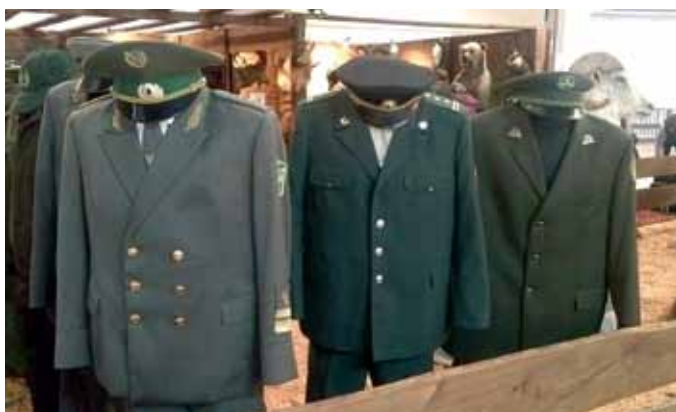
Izstādē varēja aplūkot dažādus meža dienesta formas tērpus

Izstādē aplūktas arī tēmas, kas saistītas ar meža un medību uzraudzību, izglītības jautājumiem, vēsturi, nozares sabiedriskajām organizācijām.