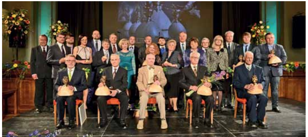
Meža nozares gada balvas „Zelta čiekurs” laureāti un ieguvēji

Visi balvas „Zelta čiekurs” ieguvēji saņēma arī Ministru kabineta Atzinības rakstus.