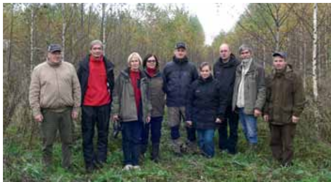
„Skogssallskapet” Latgales iecirkņa komanda pie 10 gadu veca bērzu stādījuma

Stādiem ar uzlabotu sakņu sistēmu ir daudz priekšrocību.