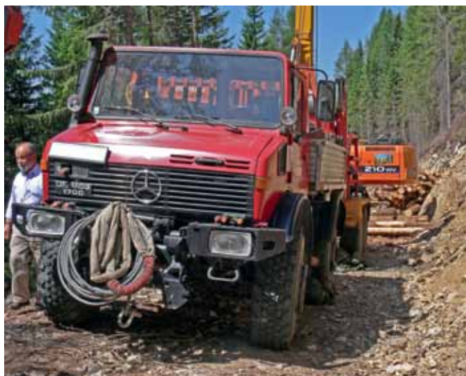
Tehnika piemērota kalnu apstākļiem