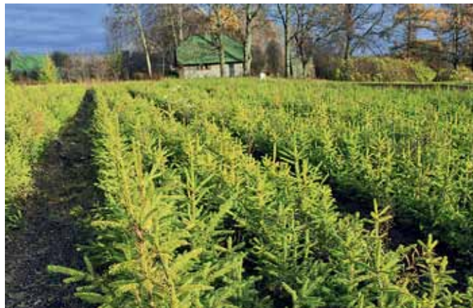
Ojāra izaudzētie eglu stādi šogad padevušies vareni

pus. Nelielā daudzumā ir arī melnalkšņu stādi. Stādus audzē no augstvērtīgām sēklām, kuras iepērk no AS «Latvijas