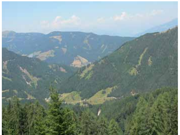
Austrijā lielākā daļa mežu aug kalnu nogāzēs

ņiem un treilēšanas iekārta tiek laista atpakaļ lejā. Uz ekskavatora bāzes ir uzstādīta harvesterā galviņa, un harvesteris paņem izvilktos stumbrus un sagatavo sortimentus. Pa šo laiku koku gāzējs nozāģē nākamo koku. Tā divi strādnieki maiņā