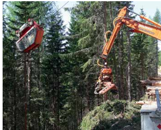
Trošu treilēšanas sistēma

Otrais strādnieks atrodas uz ceļa un pārņem vadību savā pārziņā. Kad stumbri ir izvilkti augšā, tie tiek novietoti šķērsām pāri ceļam, atbrīvoti no cilpe-