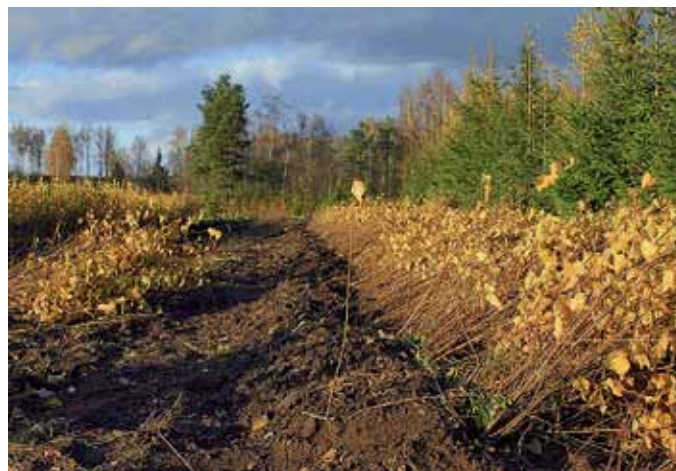
Kokaudzētavā audzē arī bērzu stādus, kas sagatavoti tirgošanai

«To, kas notiks stādu tirgū tad, kad būs izauguši tie stādiņi, ko iesējām šopavasār, ir grūti prognozēt. Kopš 1995. gada ir bijuši pieņemti pieci dažādi Meža atjaunošanas noteikumi , bijuši pieejami Eiropas atbalsti, bijušas vētras ar lieliem mežu postījumiem, ir nākuši klāt jauni LVMI «Silava» un citu zinātnieku pētījumi un atziņas par mežu – ko un kā labāk darīt. Tas viss nenoliedzami ir ietekmējis un arī turpmāk ietekmēs mūsu darbošanos stādu audzēšanas sfērā. Taču, kamēr vien Latvijā šāls meži un tos kāds ap-