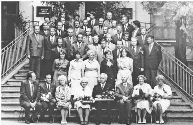
Tehnikuma 11. izlaiduma salidojums 1984. gadā (25 gadi pēc beigšanas)