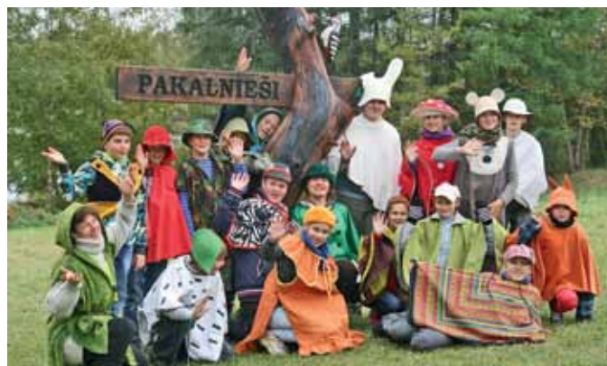
Grundzāles pamatskolas skolēni „Pakalniešos”

MKPC Apmācību centra „Pakalnieši” vadītāja