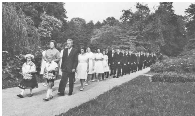
Tehnikuma audzēkņu pilngadības svētku gājiens. Tos svinēja visi Aizupē, neatkarīgi no kuras Latvijas puses katrs bija

abām māsām. Taču pēdējos gados šīs vietas nesakoptība un pamestība rada ļoti nospiedošu iespaidu. Kādreizējais lepnums – stadions – ir aizaudzis ar kokiem. Oguļāju krūmi mazdārziņos, savā laikā vecajā parkā sameklēti un ar lielu rūpību pārstādīti, joprojām ražo, bet daudzi un nesnes pārsniedz cilvēku augumu. Daba ļoti ātri pārņem cilvēku atstātas, kaut arī kādreiz ar mīlestību iekoptas un lolotas vietas.