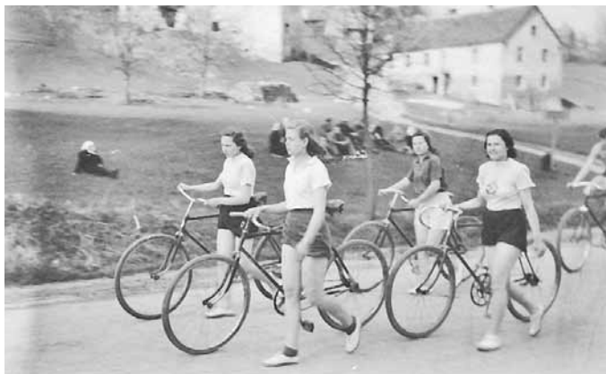
Tehnikuma audzēkņi dodas uz 1. maija demonstrāciju Kandavā

MKPC Dienvidkurzemes nodaļas vadītāja vietniece