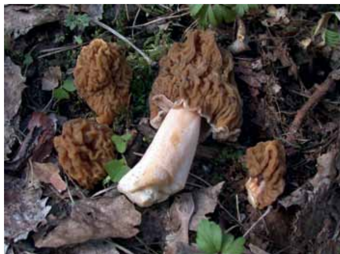
Parastais ķēvpups Verpa bohemica

MKPC Rīgas reģionālās nodaļas mežsaimniecības konsultante