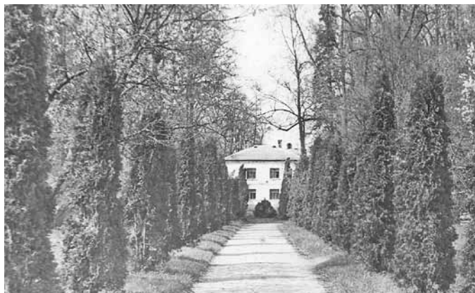
Skats uz Aizupes meža tehnikumu no vecā stādu dārza puses