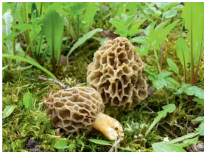
Parastais lāčpurns Morchella esculenta