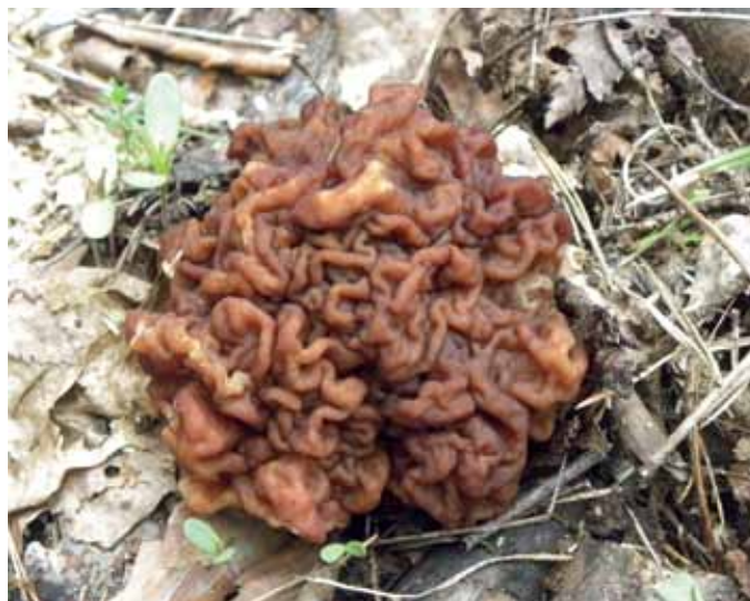
Parastā bisīte Gyromitra esculenta

romitrīnu, kas sēnēs uzkrājas lielākos daudzumos. Tāpēc bez pareizas apstrādes bisītes uzturā nav lietojamas. Tās vārot, var saindēties tikai ieelpojot tvaikus! Giromitrīns, sēni vārot, karstā ūdenī nešķīst. Tā lielākā daļa sadalās, žāvētas sēnes pusgadu glabājot nenošlēgtā traukā. Drošības apsvērumu dēļ speciālisti iesaka šīs sēnes uzturā nelietot.