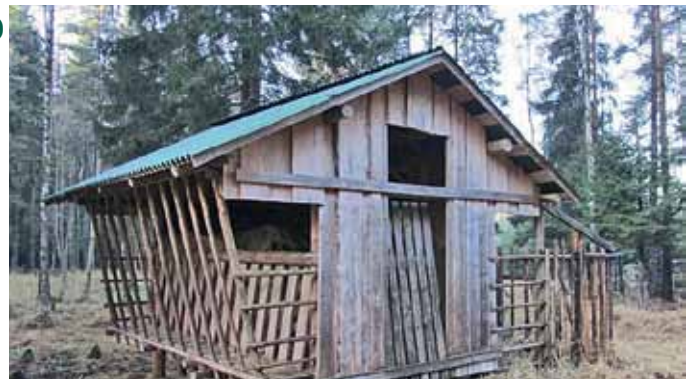
Speciāli ierīkota barotava meža dzīvnieku piebarošanai

Piebarošanas vietu (barotavu) izvietošana veicama saskaņā ar šiem noteikumiem un rakstisku zemes īpašnieka vai