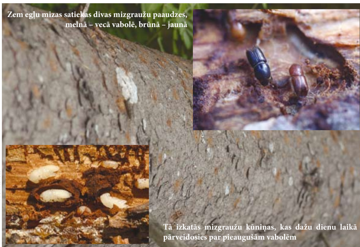
Zem egļu mizas satiekas divas mizgraužu paaudzes, melnā – vecā vabolē, brūnā – jaunā

Vidēji valstī pieaugušās egļu audzēs 2007. gada vasarā mizgrauzis iznīcināja gandrīz 3% egļu, kas vecākas par 50 gadiem.