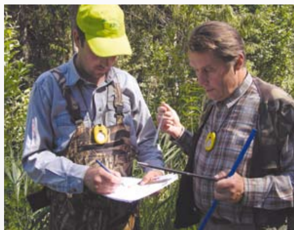
Pilnīgāka cirtsmu sagatavošana garantēs tās pārdošanu par augstāku cenu

audzes šķērslaukuma noteikšanā, vienlaikus aprēķinot aptuveno iegūstamo koksnes krāju. Papildus vēlams sagatavot vairākus parauglaukumus raksturīgās cirtsmas vietās, atzīmējot izcērtamos un atstājamos kokus,