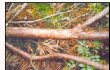
Stumbra galotnes daļai bija uzbrucis galotņu sešzobu mizgrauzis

priežu saknēs konstatēta sakņu trupe. Sakņu trupe, kā zināms, koku novājina. Nogāžot vienu no bojātajiem kokiem, varēja redzēt, ka vainaga augšējās daļas skujas bija bojājusī zāglapsene. Pēc zāglapsenes stumbra galotnes daļai bija uzbrucis galotņu sešzobu mizgrauzis, bet stumbra apakšējā daļā viegli bija pamanāmi priežu divpadsmitzobu mizgrauža