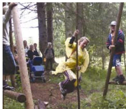
Pāri grāvim sausām kājām!!!