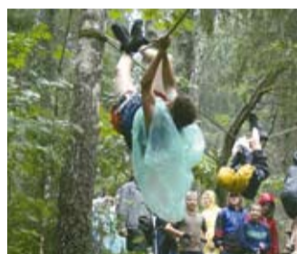
“No koka uz koku”

Kārumniekiem aiz paparžu zaļajiem čemuriem uz sūnu ciņiem zilās actiņas mirdzināja dažādas meža veltes, kuras, šķiet, tā vien gaidīja, kad tās kāds ieraudzīs un nāks mieloties.