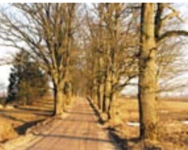
Vērenes muižas aleja

gas, gar kurām saraka grāvjus un papildus veica meža meliorācijas darbus. Tā laika meliorācijas sistēma redzama arī mūsdienīgu mežaudžu plānos. Arī kvartālu sistēma saglabāta sākotnējā. Malējos kvartālos paralēli kvartālu stīgam izdzina “zvēru stigas”, uz kurām medību laikā stādīja medniekus. Arī no šīm stīdžām daļa saglabājusies vēl mūsdienās.