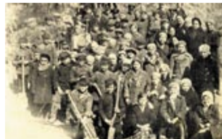
Meža dienu dalībnieki Viļakas virsmežniecības Žiguru novadā.

M eža dienas ir tradīcija no Latvijas brīvvalsts laikiem. Meža darbinieku biedrības 1939. gada izdevumā “Meža Dzīve” izlasītais ļauj secināt, ka mežu darbinieki Latvijas laikos mājēja gan strādāt, gan atpūsties. Daži fragmenti.