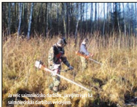
Ja veic saimniecisko darbību, jāreģistrējas kā saimnieciskās darbības veicējam.

Piemērojot likuma 9. panta pirmās daļas 19. punktu, sava īpašuma pārdošanas ienākumus nodala no saimnieciskās darbības ienākumiem — ienākumiem no pārdošanai izgatavotu vai iegādātu izstrādājumu (mantas) pārdošanas, izvērtējot darījumu ekonomisko būtību un veikto darījumu regularitāti un apjomu (MK noteikumu Nr. 793 54. punkts).